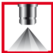
INYECTOR SIN ADERCO

La acción limpiadora y lubricante de ADERCO, así como su efecto dispersante, hace que los sistemas de inyección atomicen el gasoil con la máxima eficacia